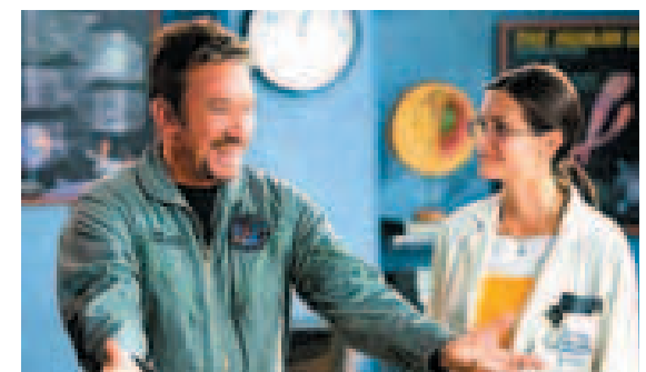
Zoom, con Tim Allen.

G: Público general; PG: Se sugiere la orientación de los padres o guardianes que algún material del contenido en estas películas podría resultar impropio para menores de 13 años; R: Restringidas a menores de 17 años si no van acompañados de sus padres o guardianes; NC-17: No se admitirá a menores de 17 años.