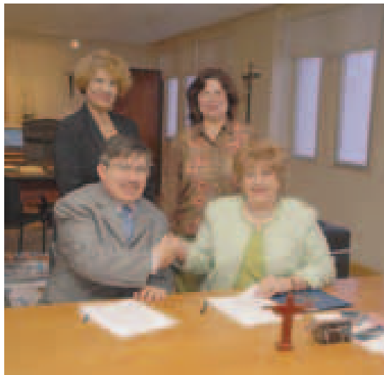
La Católica compartirá sus instalaciones bibliotecarias con los estudiantes y empleados de la Universidad de Puerto Rico, en Ponce.

Además, el memorando de entendimiento estipula que una vez culminen las mejoras a la infraestructura de la biblioteca Adelina Coppin-Alvarado, sus materiales e instalaciones podrán ser utilizados por la PUCPR. La duración del convenio será de dos años o hasta que la remodelación esté completada.