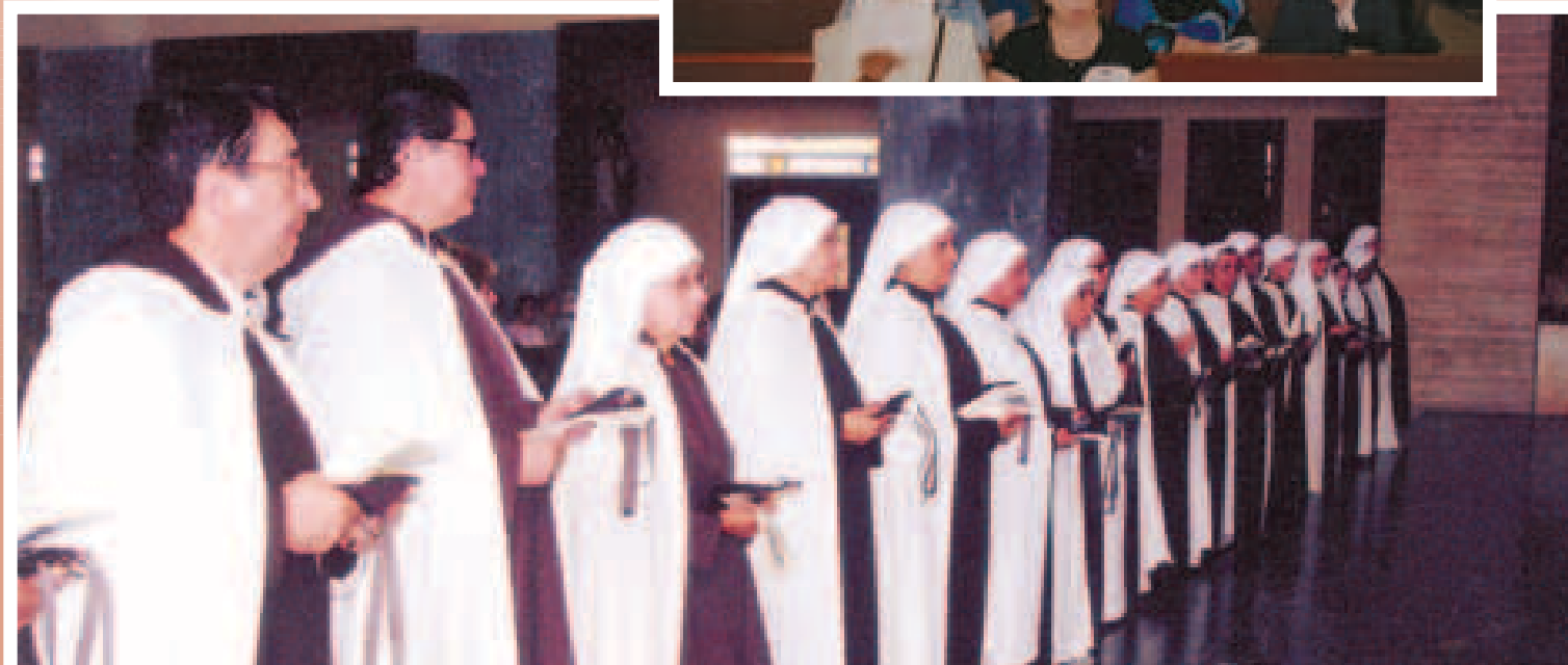
Profesión intercomunitaria 2006