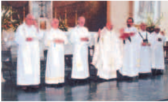
Profesión intercomunitaria 2006

de laicos carmelitas se convierte de este modo en un centro de vida auténticamente humana porque es auténticamente cristiana. Por experiencia se sabe que, cuando nos reconocemos como hermanos y hermanas, entonces nace la exigencia de involucrar a los otros en la aventura fascinante humano-divina, de la construcción del Reino de Dios.